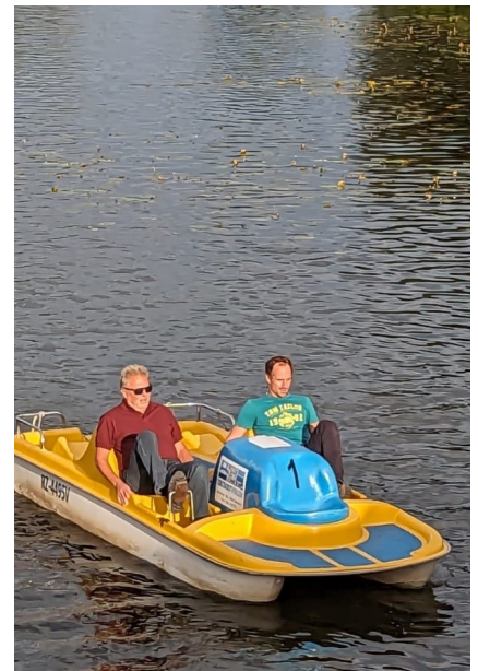
Boot des LV Baden-Württemberg bei der Regatta „Grünes Band“

Ein weiterer, wichtiger Tagungsordnungspunkt war die Neuwahl des Bundesvorstands. Hier war's dann einfach. Der alte Vorstand ist der neue Vorstand, sodass nun tatsächlich in Ruhe daran gegangen werden kann, die Weichen für die Zukunft zu stellen.