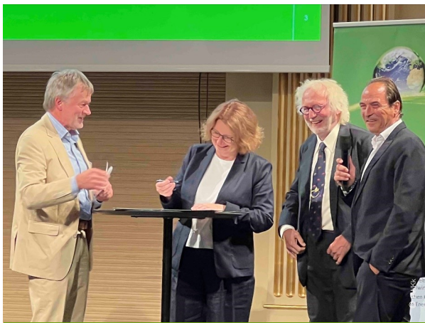
Abschluss der Kooperationsvereinbarung mit dem HKC

2022 schlug der Vorstand unseres Landesverbandes vor, einen vergleichbaren Preis einzuführen, der auf Vorschlag des Chefredakteurs der Fachzeitschrift nun BWK Publikationspreis heißt und erstmals in Schwerin für den Artikel mit den meisten Impressionen verliehen wurde.