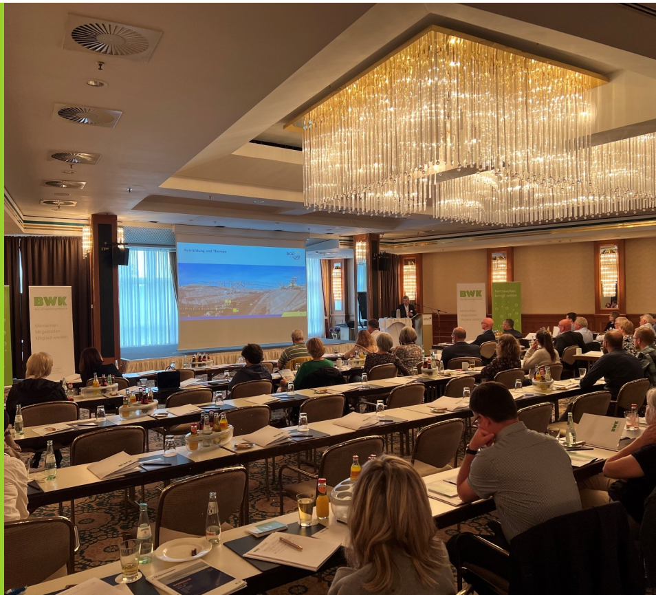
28. Landeskongress „Niedrigwasser im Spannungsfeld der Energiewende“