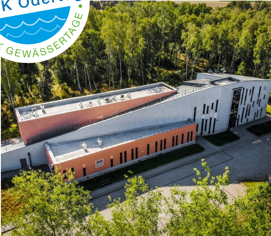
Europäisches Zentrum für Bildung und Kultur