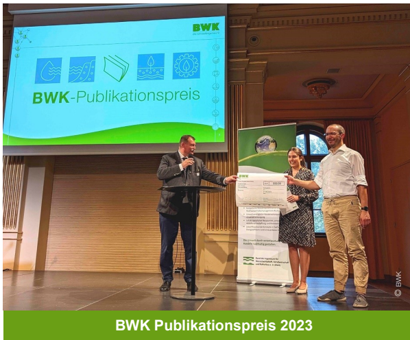
BWK Publikationspreis 2023