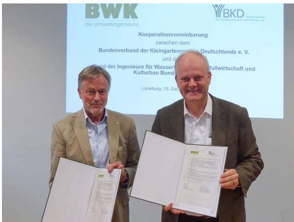
Abschluss der Kooperationsvereinbarung mit dem BKD

Die Mitgliedsverbände des Bundes der Kleingartenvereine Deutschlands stehen vor ähnlichen Problemen, wie unsere Mitglieder. Trockenheit und Überflutungen sind Themen, die Kleingartenanlagen direkt betreffen. Erfahrungsaustausch und gegenseitige Unterstützung stehen daher im Fokus der mit dem BKD geschlossenen Vereinbarung.